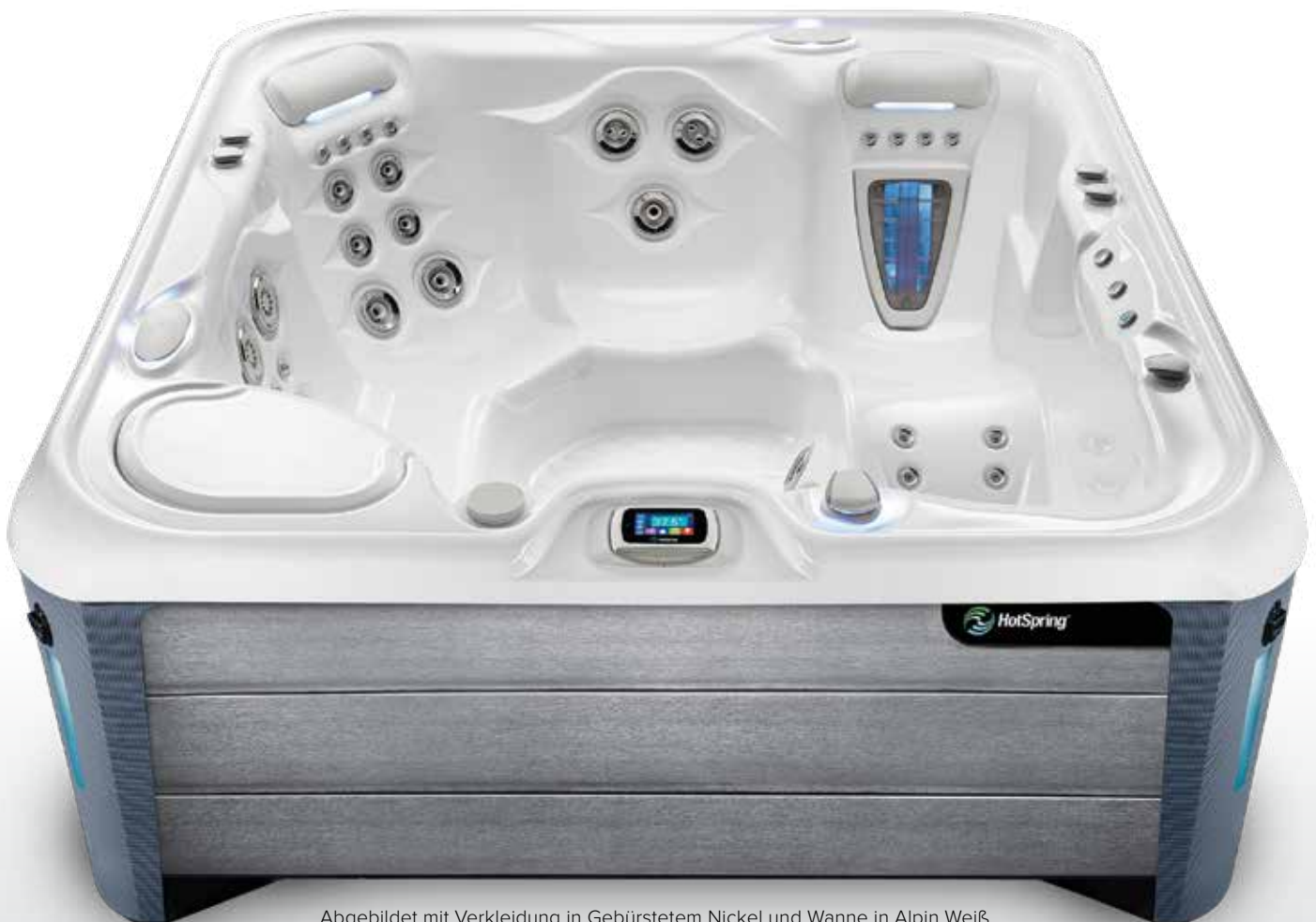
Abgebildet mit Verkleidung in Gebürstetem Nickel und Wanne in Alpin Weiß.

Unsere Designer haben eine unverwechselbare Farbpalette mit sechs Verkleidungsvarianten und verschiedenen Wannenfärbungen entwickelt, damit Sie genau den Look bekommen, der zu Ihnen passt.